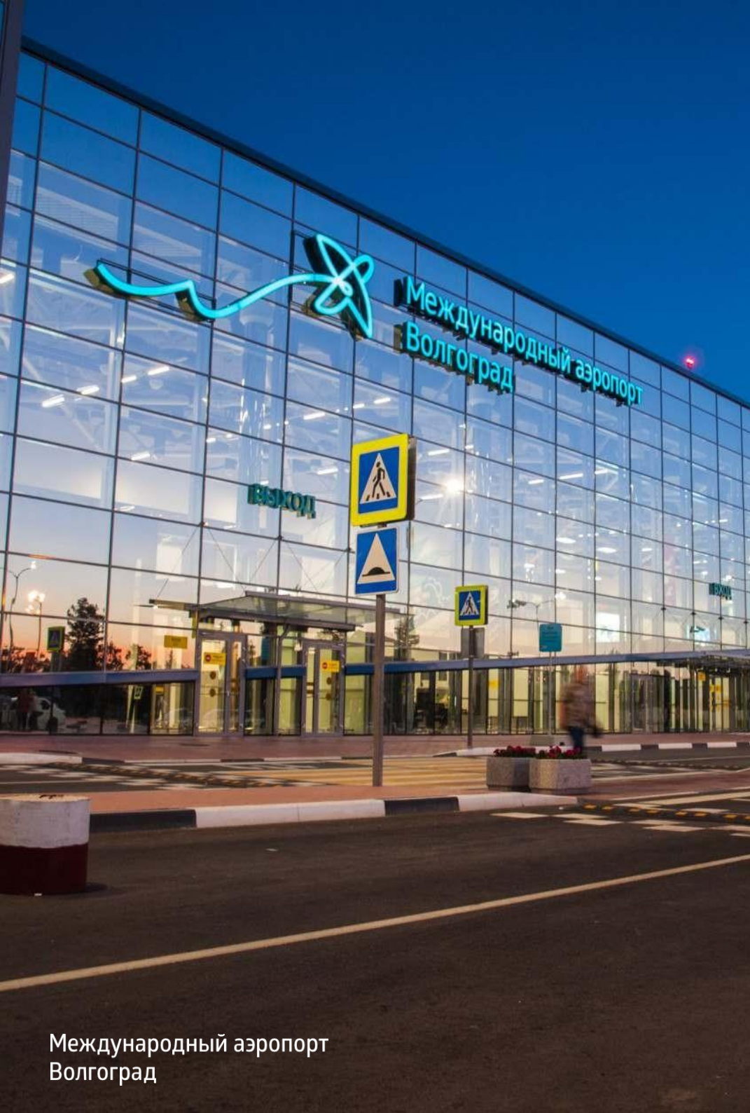
Международный аэропорт Волгоград