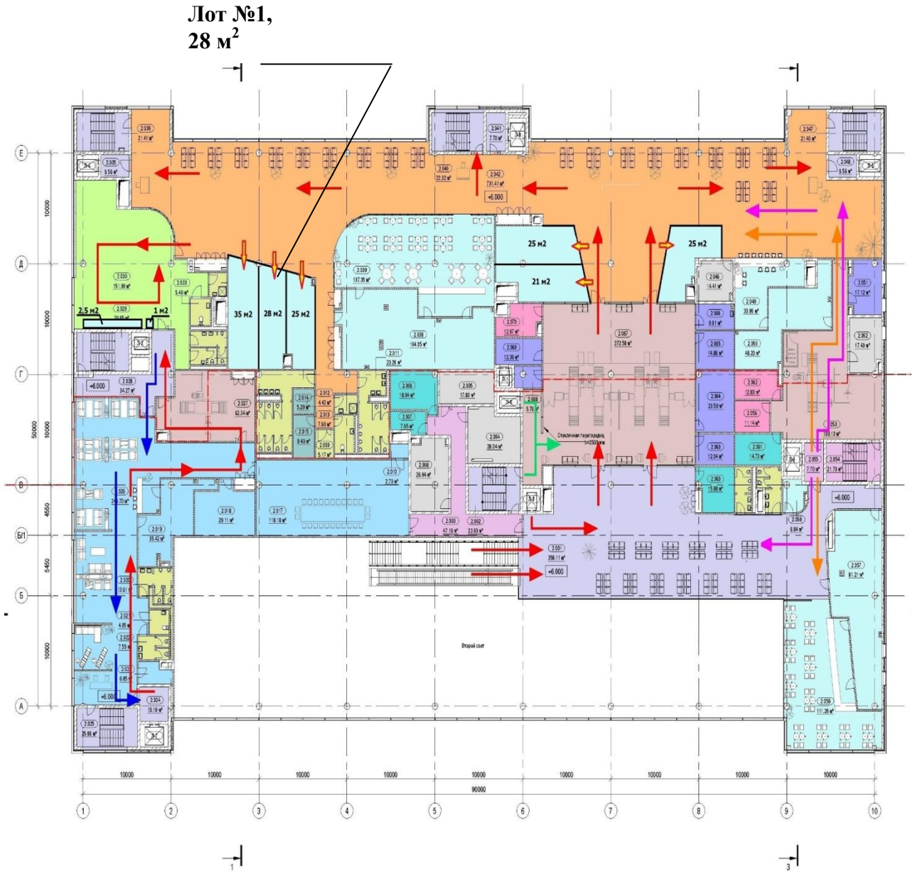
Схема расположения помещения на втором этаже стерильной зоны терминала внутренних авиалиний