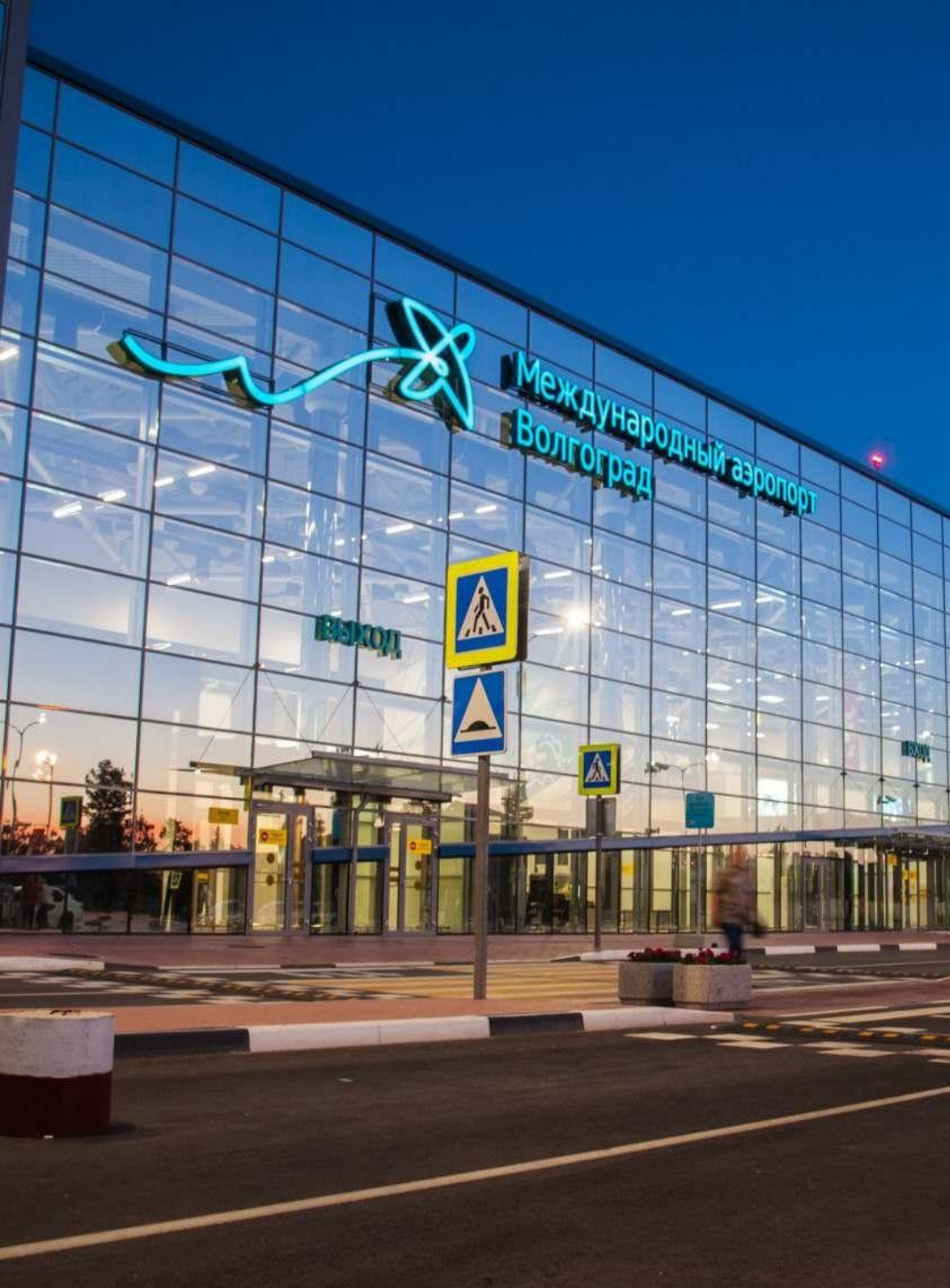
Международный аэропорт Волгоград